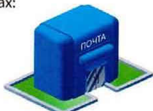
Отделения почтовой связи

КРАЕВАЯ ГОРЯЧАЯ ЛИНИЯ по вопросам перехода на цифровое телевидение