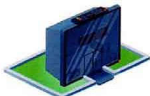
Магазины электроники и бытовой техники

Приобрести новое телевизионное оборудование можно в следующих местах: